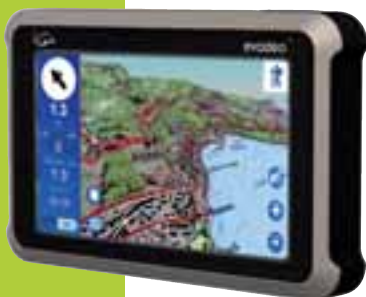
GPS Evadeo X