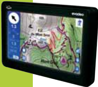
GPS Evadeo M

La série X est la nouvelle référence Evadeo. Bénéficiant de tous les avantages de sa petite sœur, la série M, elle détient deux nouveautés exclusives : le guidage vocal sur sentiers et la navigation sur carte en relief 3D. La série X est également disponible en version France (X50) et Europe (X60).